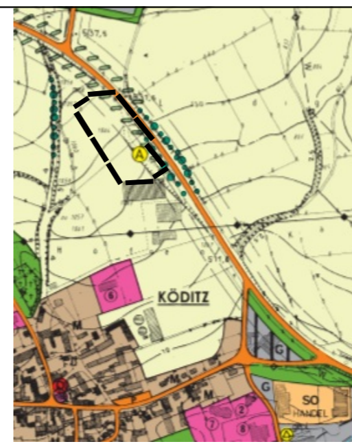
Ausschnitt aus dem aktuell wirksamen Flächennutzungsplan der Gemeinde Köditz, Maßstab 1:10.000